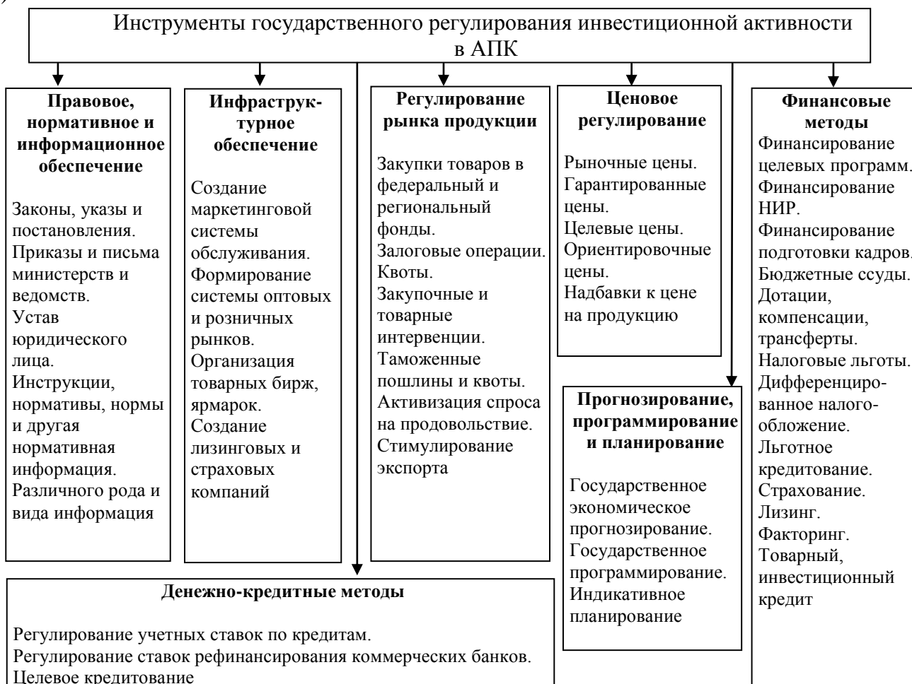
Рисунок 1. Классификация инструментов государственного регулирования инвестиционной активности в АПК

Представленная классификация имеет общий характер, но при этом, если брать во внимание специфику предмета нашего изучения, у нее есть некоторые недостатки, которые связаны с четким разделением инструментов государственного регулирования на административные и финансовые. На наш взгляд, более практично разделение инструментов госрегулирования инвестиционной активности на экономические, которые в свою очередь подразделяются на программно-целевые и непрограммные, и организационно-финансовые, которые обеспечивают возможность объединения средств муниципальных или городских бюджетов. Сюда относятся: регулирование отношений собственности и земельных отношений, регулирование тарифов и цен, налоговое регулирование, регулирование ввоза и вывоза сельхозпродукции, внешней торговли, регулирование механизмов финансового оздоровления предприятий, введение запретов, различных льгот и ограничений и т.д. (рисунок 1).