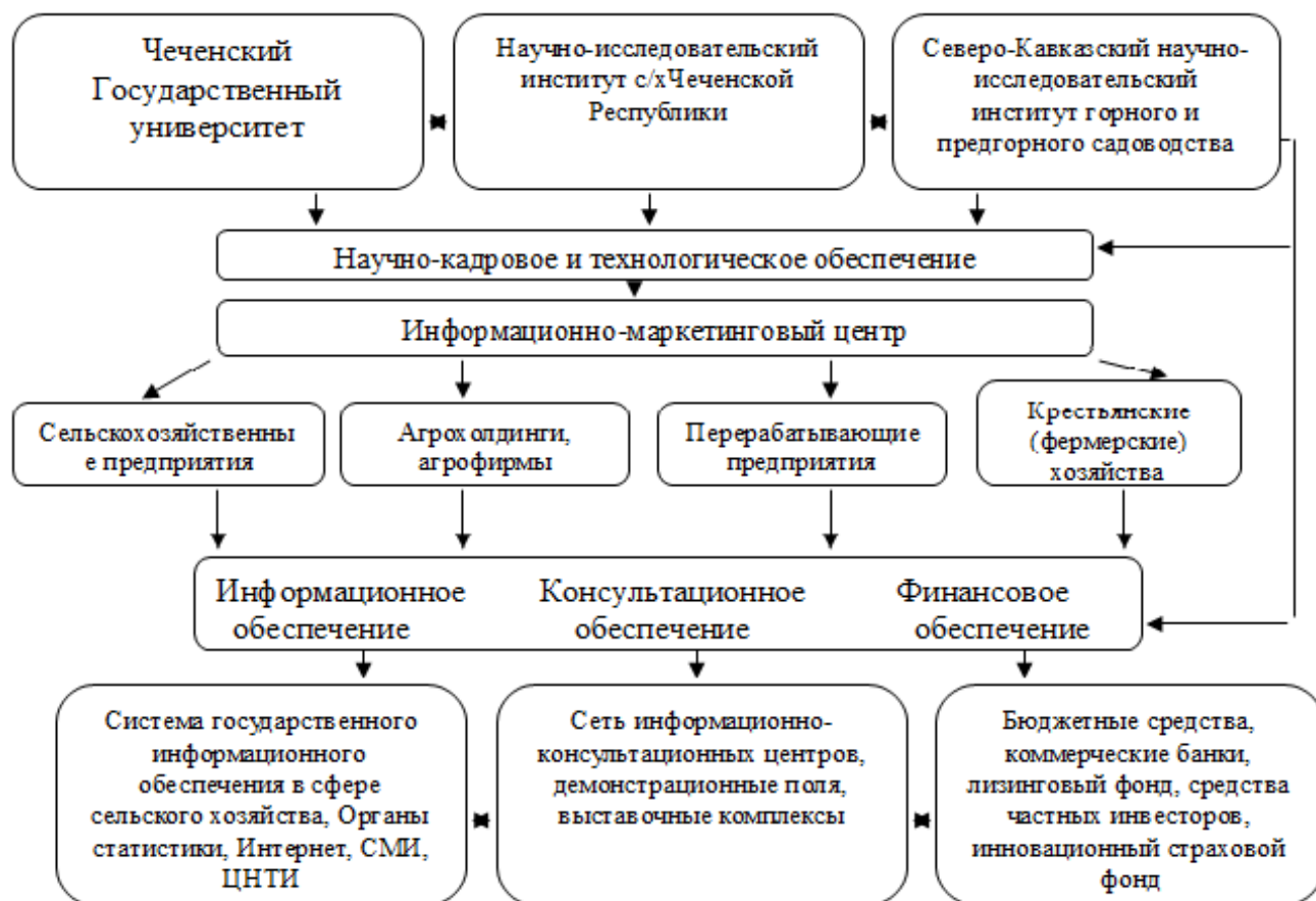
Рисунок 3. Структура предлагаемого агротехнопарка Чеченской Республики *Рисунок составлен по данным исследования автора

производственно-инновационное взаимодействие специалистов АПК и агробизнеса. Примерная структура предлагаемого агротехнопарка в системе региональной инновационной инфраструктуры представлена на рисунке 3. В состав агротехнопарка Чеченской Республики входят ЧГУ, КНИИ РАН и ЧНИИСХ, информационно-маркетинговый центр, сельскохозяйственные предприятия различных форм собственности и финансовые структуры.